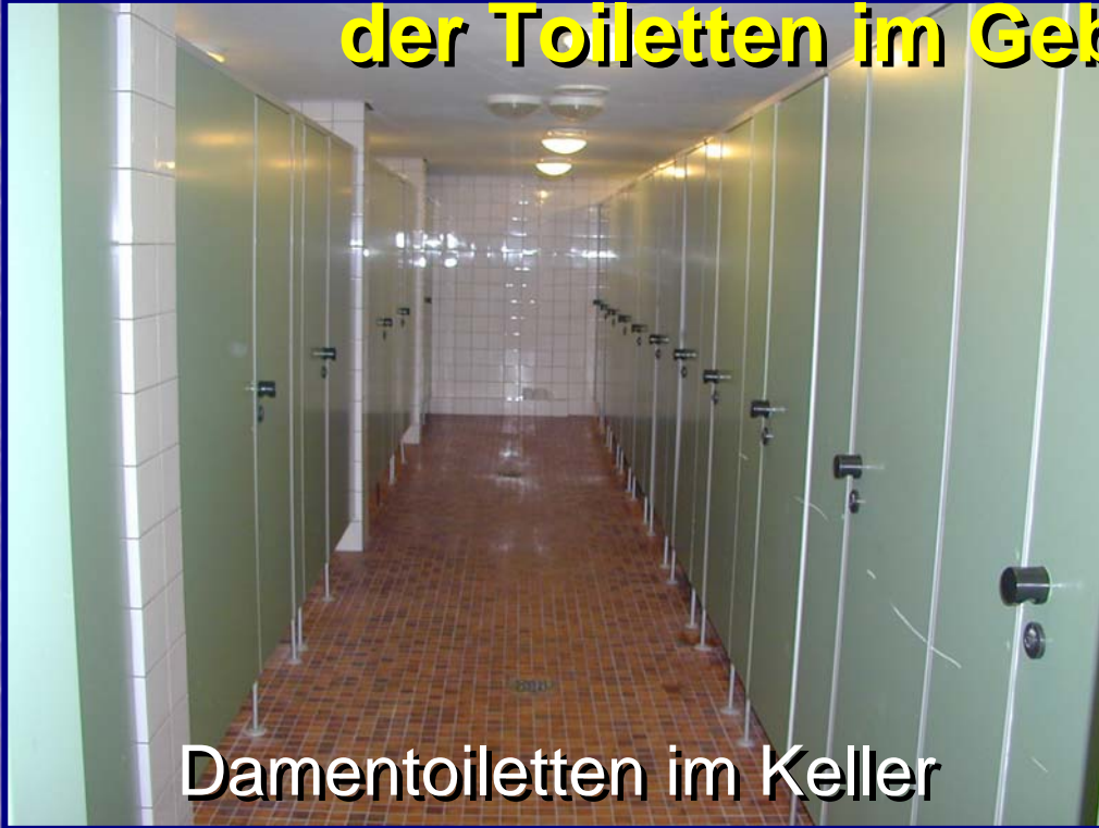
Damentoiletten im Keller