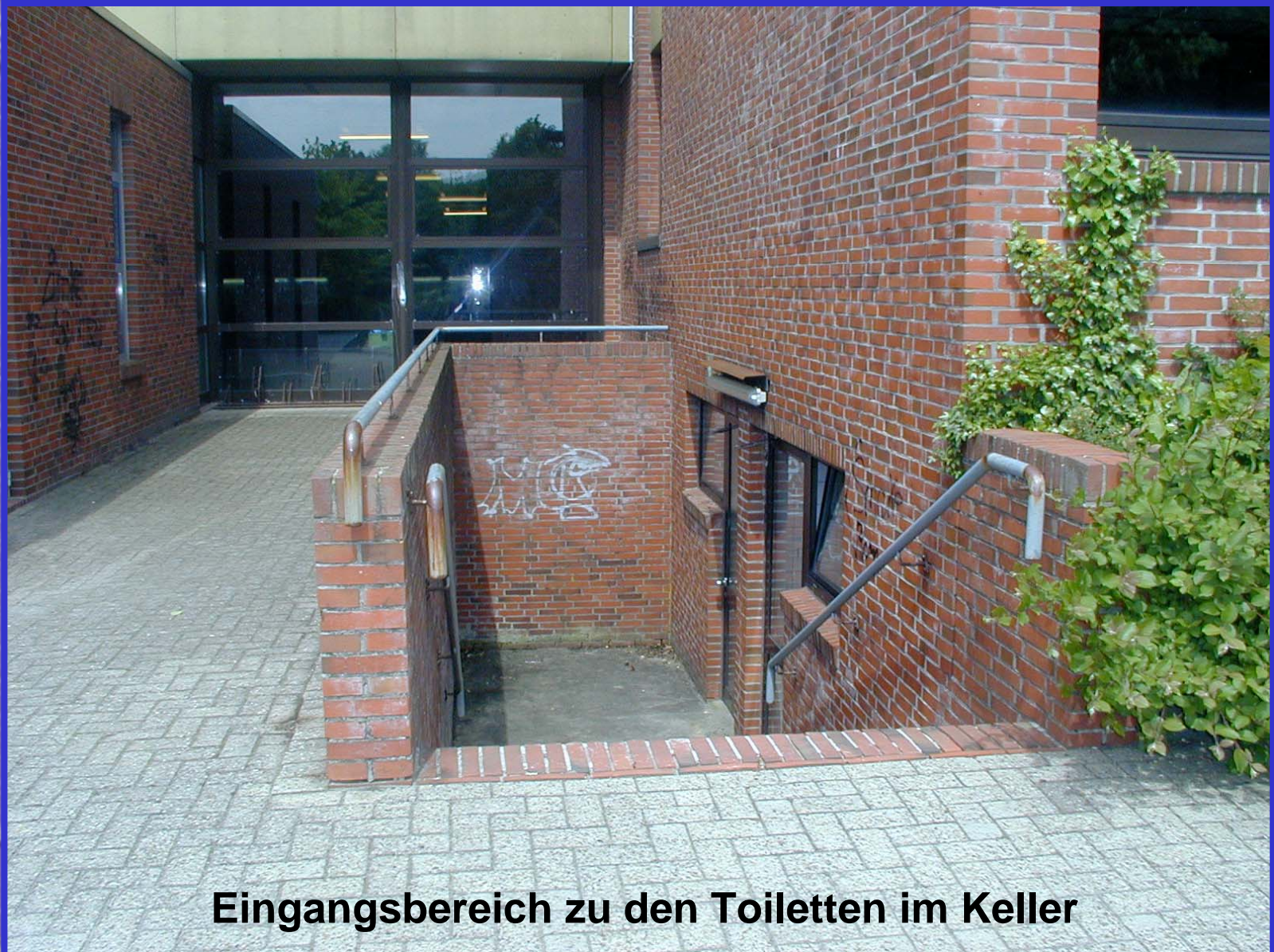
Eingangsbereich zu den Toiletten im Keller