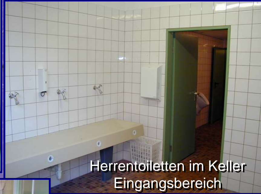
Herrentoiletten im Keller Eingangsbereich