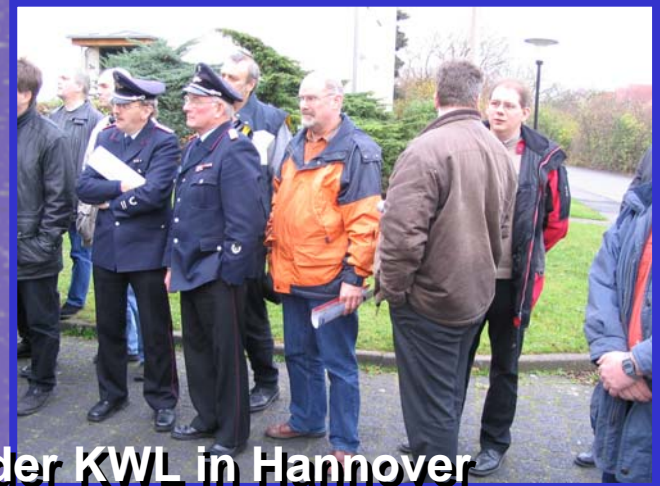
TSP Vergleichsvorführung 11/06 bei der KWL in Hannover