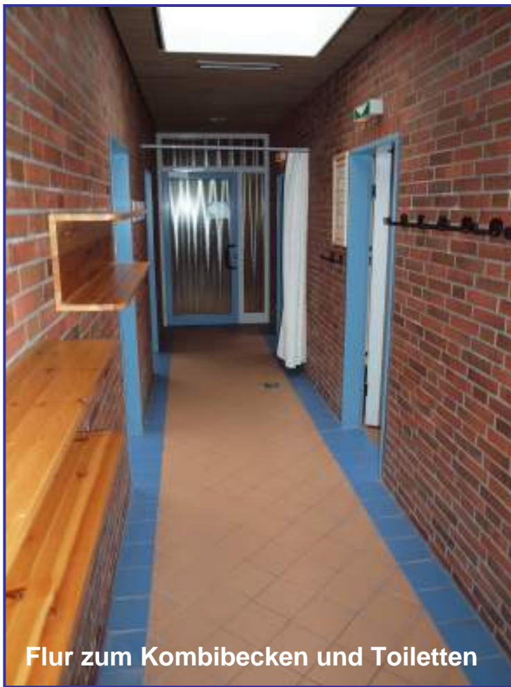
Flur zum Kombibecken und Toiletten