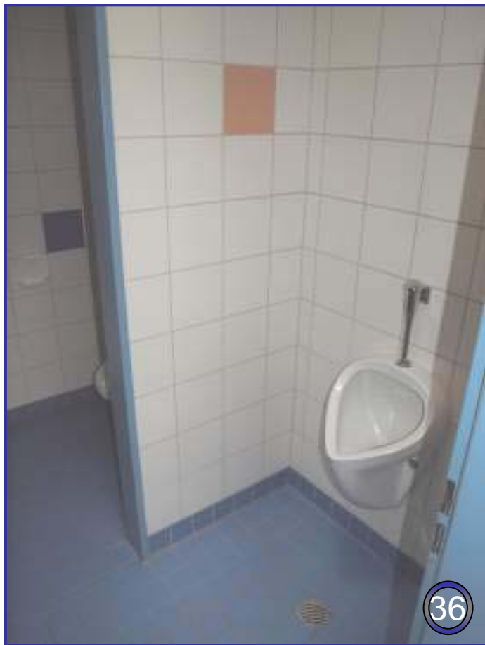
Herren-WC und Duschen