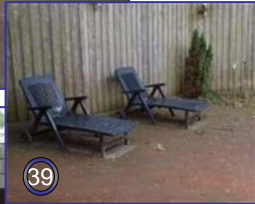
Farbsauna im Außenbereich