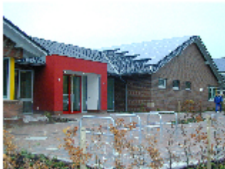
Integrationsgruppen muss aufgrund fehlender Nachfrage in eine Regelgruppe umgewandelt werden.

In der Gemeinde Rastede werden zur Zeit insgesamt vier Integrationsgruppen in den Kindergärten Feldbreite, Hahn-Lehmden, Loy und Marienstraße betrieben. Für die 16 integrativen Plätze liegen nur 11 Anmeldungen vor, sodass entsprechend den Vorgaben des Landes-sozialamtes im neuen Kindergartenjahr anstatt vier nur noch drei Integrationsgruppen weiter betrieben werden können. Die Integrationsgruppe im Kindergarten Feldbreite wird daher in eine Regelgruppe umgewandelt, wodurch in der Folge 11 zusätzliche Regelplätze bereitgestellt werden können.