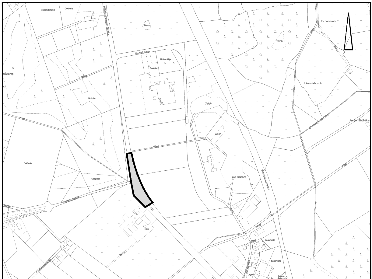
Übersichtsplan M. 1 : 10.000