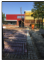
Nach dem Einbau der Fundamente soll in Kürze die Sohle betoniert werden.

Mit den Bauarbeiten an der Erweiterung der KGS Rastede wurde in den Sommerferien begonnen.