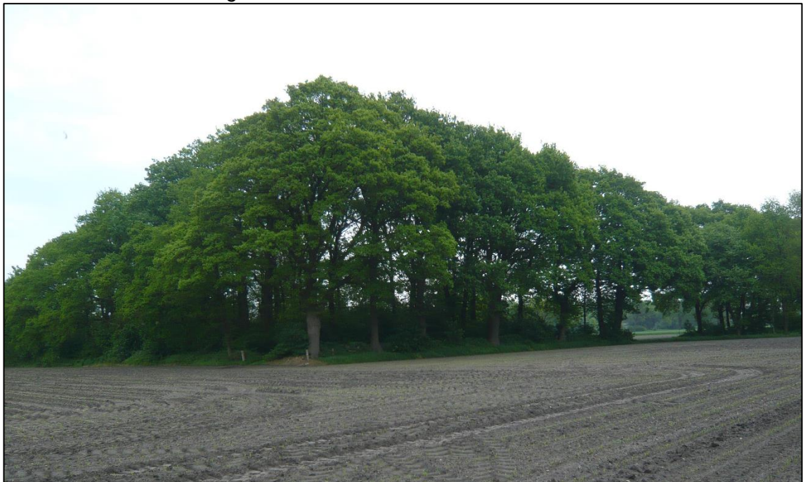
Abbildung 1: Waldbereich im Nordosten, Waldrand mit Wallhecke.

Der Waldsaum ist als Waldrand mit Wallhecke (WRW) ausgeprägt. Dominierende Baumart ist die Stieleiche, die durchschnittliche Stammdurchmesser von 0,6 m bis 1,0 m aufweist. Im Osten geht der Waldbereich, getrennt durch einen Graben, in den Gehölzbestand der ehemaligen Braker Bahn über.