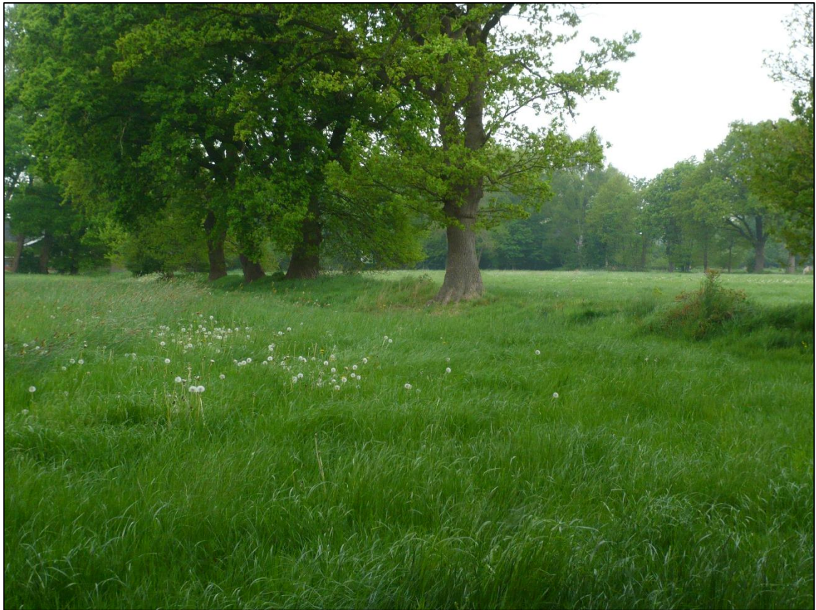
Abbildung 4: Grünlandbereich im Südwesten mit Blick auf gliedernde Wallhecke.