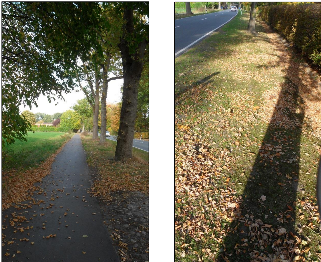
Abbildung 6: Parallel verlaufender Fuß- und Radweg mit markantem Baumbestand im Bermenbereich (Westseite) sowie als Scherrasenfläche genutzte Straßenberme auf der Ostseite der Butjadinger Straße (Quelle: Verfasser, Oktober 2018).

hauptsächlich von Stieleichen, Gewöhnlicher Esche und Feldahorn als auch von unterschiedlichen Sträuchern (Stechpalme, Rosen, Brombeere, Weißdorn) eingenommen.