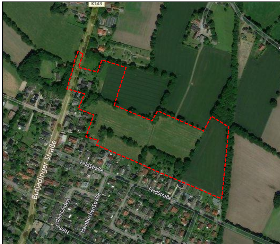
Abbildung 8: Luftbild und Lage des Plangebietes.

Das Landschaftsbild im Plangebiet ist geprägt durch weitläufige Grünlandflächen, die durch Flächen, die einer ackerbaulichen Nutzung unterliegen, ergänzt werden. Innerhalb des Geltungsbereichs verlaufen Heckenstrukturen unterschiedlicher Ausprägung, die das Plangebiet gliedern. Überwiegend handelt es sich hierbei um Baum-Wallhecken, Baum-Strauch-Wallhecken und Strauchwallhecken. Südlich des Geltungsbereichs befinden sich die Siedlungsstrukturen des Ortsteils Wahnbek/Ipwege. In nördliche sowie östliche Richtung grenzt die offene Landschaft an, die zum Großteil von landwirtschaftlichen Nutzflächen eingenommen wird.