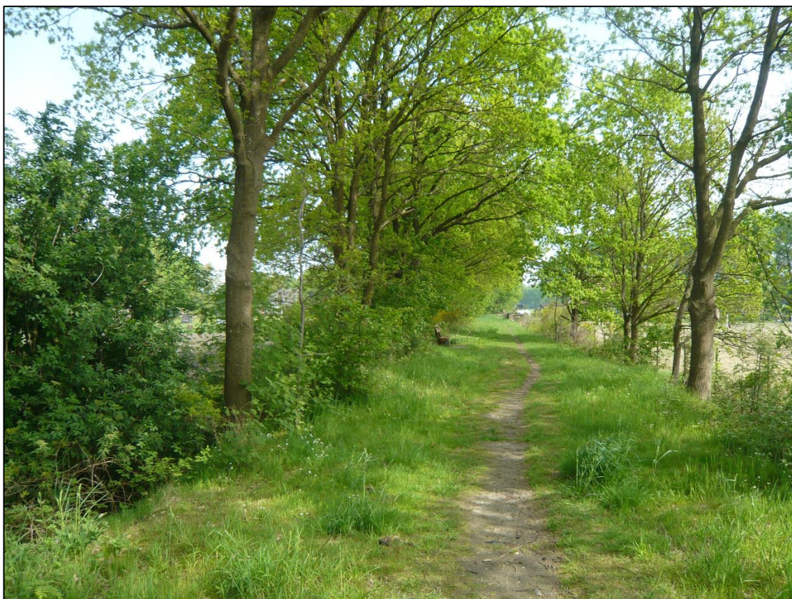
Abbildung 3: Alte Braker Bahn mit beidseitigen Gehölzstreifen.