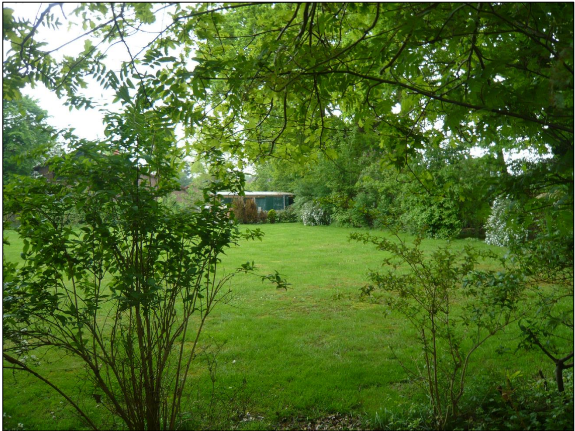
Abbildung 5: Rückwärtige Gartenbereiche mit überwiegendem Rasenanteil und einrahmenden Gehölzbeständen.

nach der dominierenden Nutzung und Ausprägung als Scherrasen (GR), Naturgärten (PHN) und Siedlungsgehölzen (HSE) unterschieden.