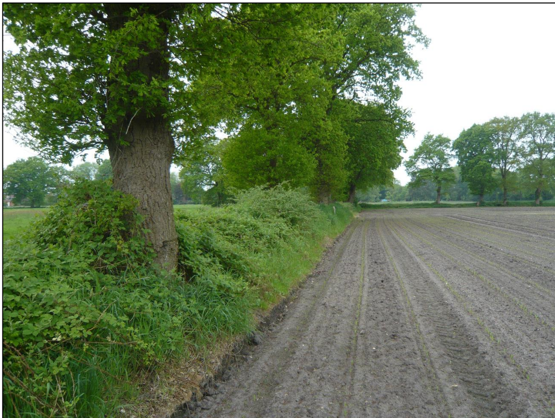
Abbildung 2: Wallhecke mit Brombeerunterwuchs, im Hintergrund Baum-Wallhecke.