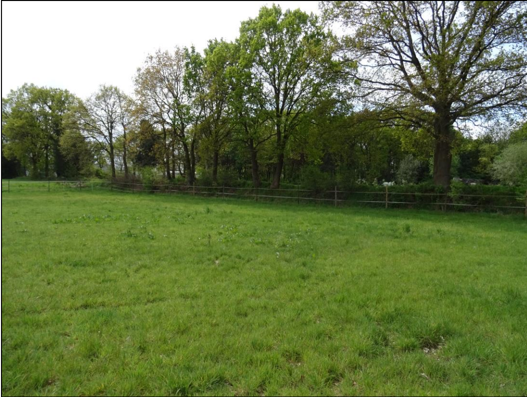
Foto 15: Extensivgrünland mit Wallhecke im Süden des Untersuchungsgebietes