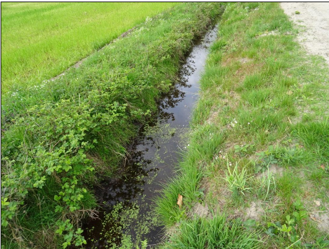
Foto 4: Wassergefüllter Grabenabschnitt am Moorweg mit Wasserstern