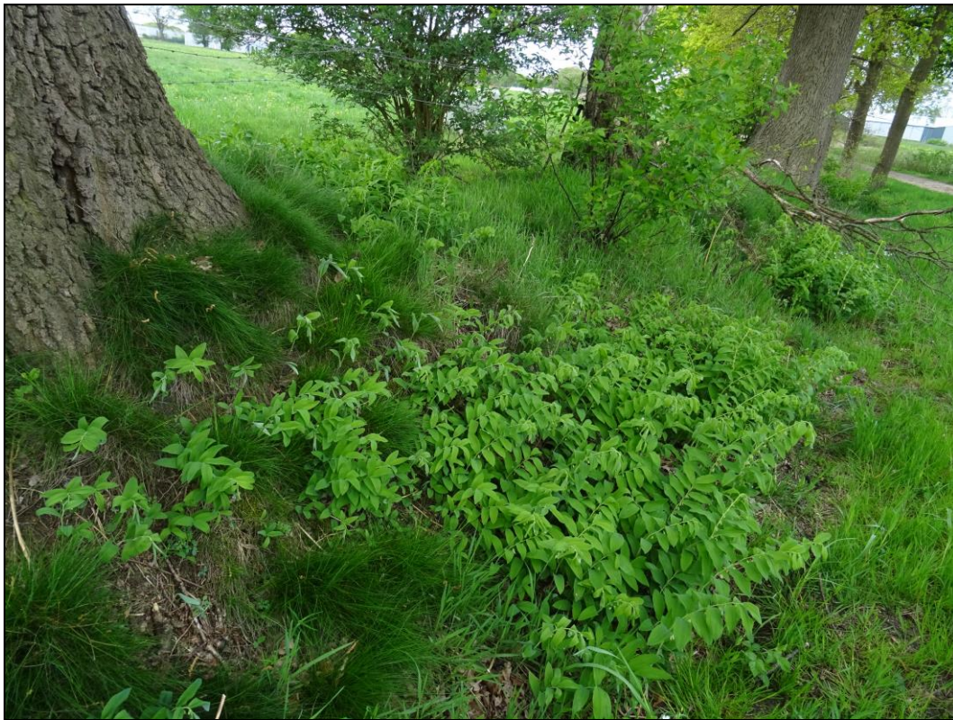
Foto 10: Wallhecke am Moorweg mit Vielblütiger Weißwurz im Unterwuchs