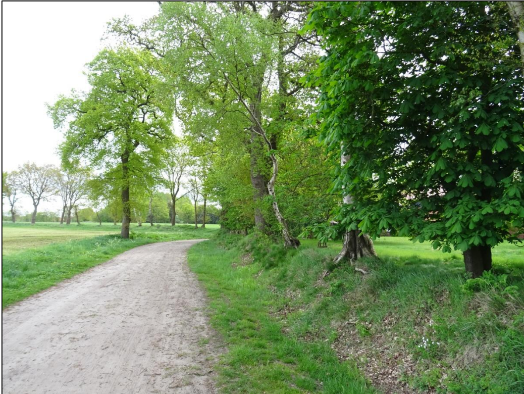
Foto 11: Wallhecke am Moorweg im Bereich des zentral im Untersuchungsgebiet gelegenen Wohnhauses