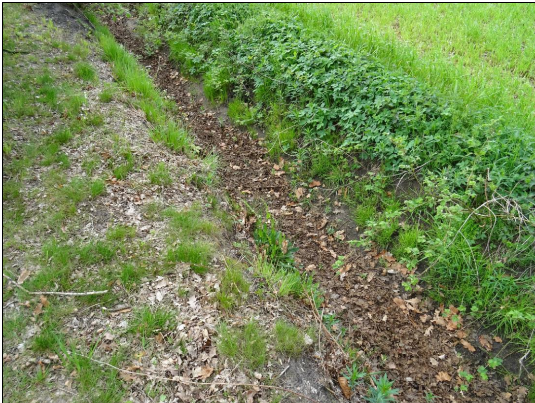
Foto 2: Trockener Graben mit halbruderaler Vegetation im Böschungsbereich