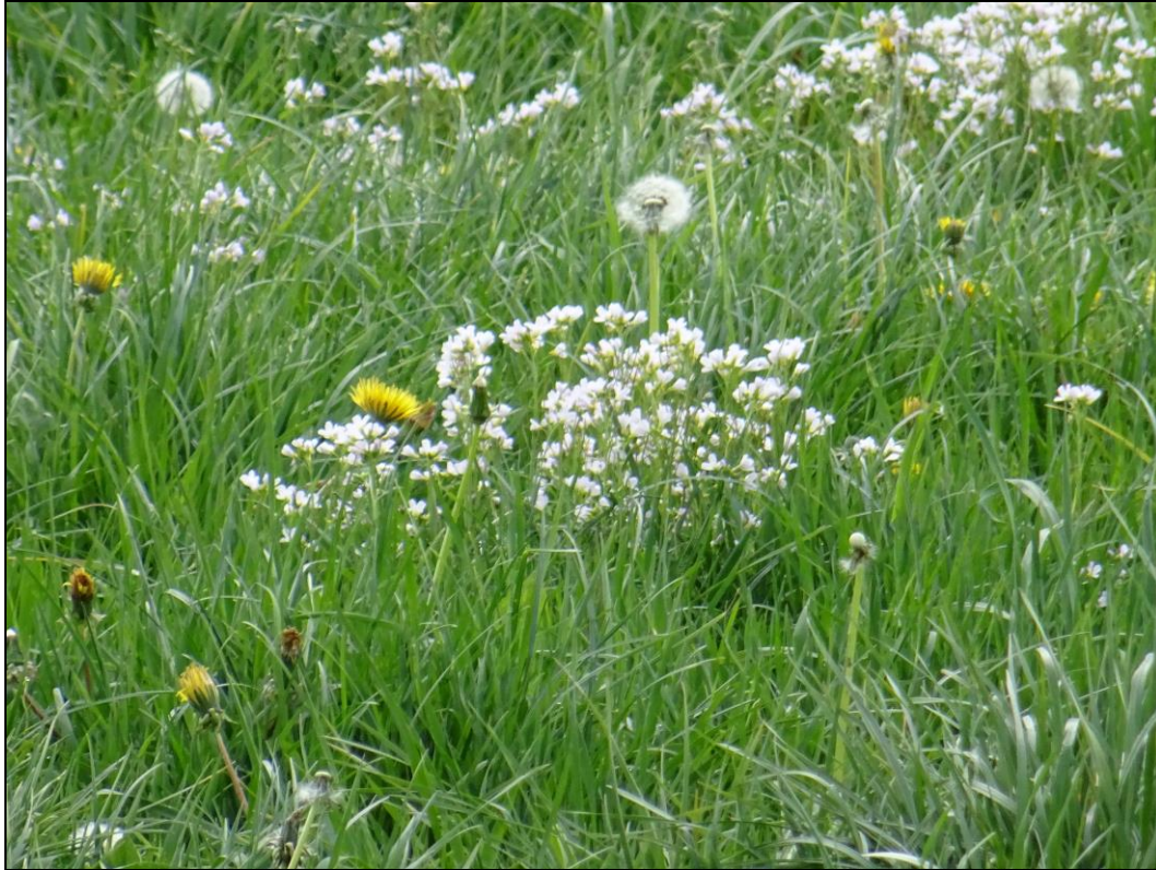
Foto 7: Feuchtes Intensivgrünland mit Wiesen-Schaumkraut und Löwenzahn