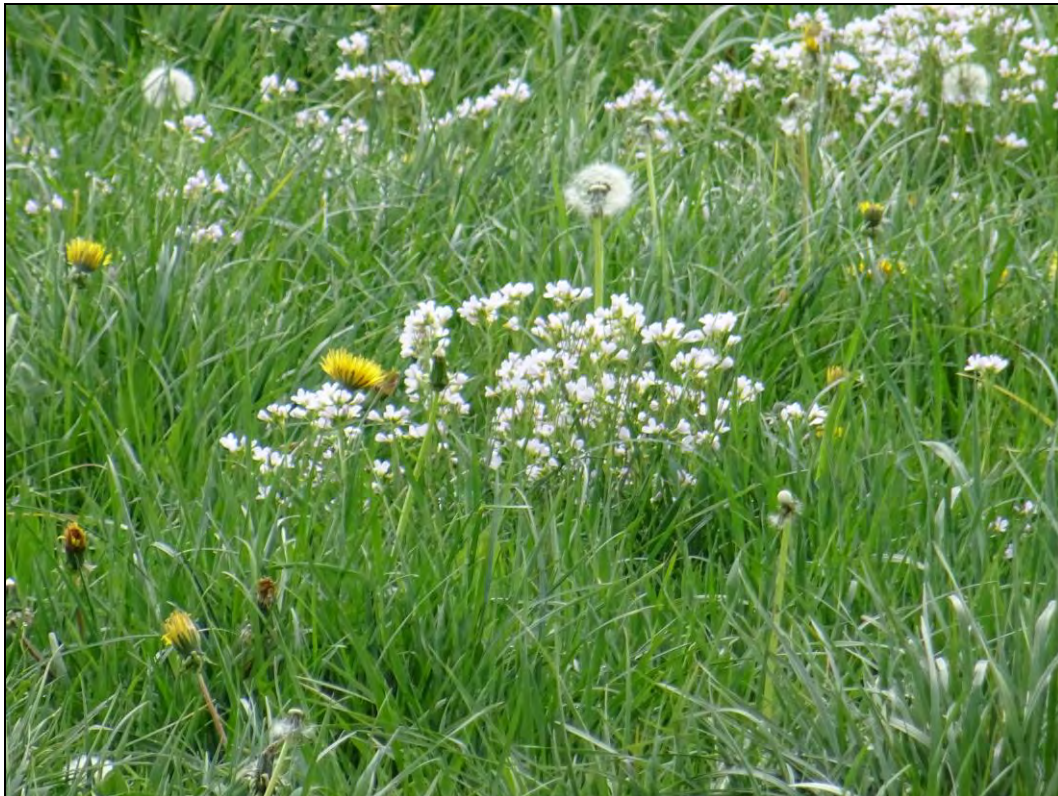
Foto 7: Feuchtes Intensivgrünland mit Wiesen-Schaumkraut und Löwenzahn