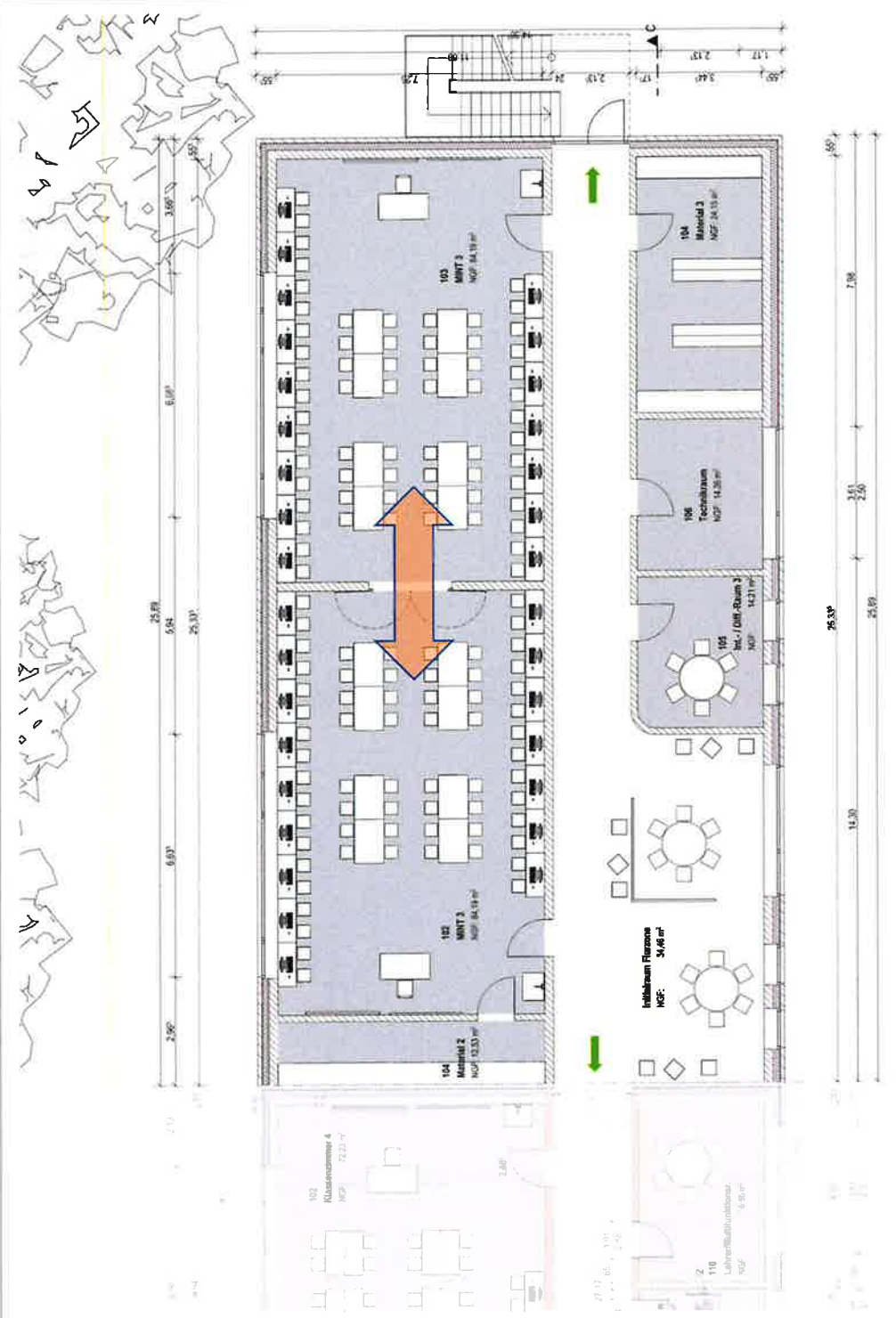
Grundriss OG: 2x Mint koppelbar; 1x I-Raum; T-Raum