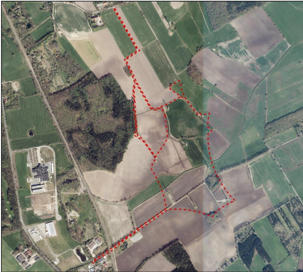
Abb. 2: Luftbildansicht und ungefähre Lage des Plangebietes (rote Linie) (Quelle: Digitale Orthophoto (DOP) – Auszug aus den Geobasisdaten der Nds. Vermessungs- und Katasterverwaltung 2023, unmaßstäblich).

Im Plangebiet befinden sich hauptsächlich landwirtschaftlich genutzte Grünlandflächen, die durch ein Grabennetz entwässert werden. Entlang der Erschließungswege und der Gräben befinden sich vereinzelte Baum- und Strauchreihen sowie Einzelbäume und -sträucher. Im Südosten des Plangebietes sowie westlich angrenzend befinden sich kleine Waldflächen.