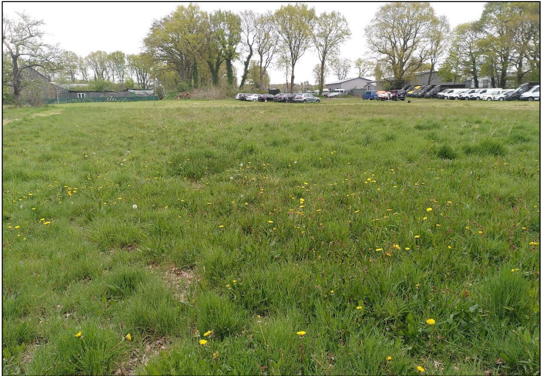
Abbildung 3: Mesophiles Grünland im Süden des Plangebiets. Foto: Mai 2022, Stutzmann.

Ein Teil der grünlandartig entwickelten Flächen wurde bereits vor der Biotopkartierung Anfang Mai erstmalig gemäht. Die Flächen wurden als Scherrasen und nicht als Grünland eingestuft, da eine landwirtschaftliche Nutzung des Schnittguts zu diesem frühen Zeitpunkt unwahrscheinlich ist und die Flächen angrenzend an weitere, als Stellflächen genutzte Rasenflächen vorgefunden wurden.