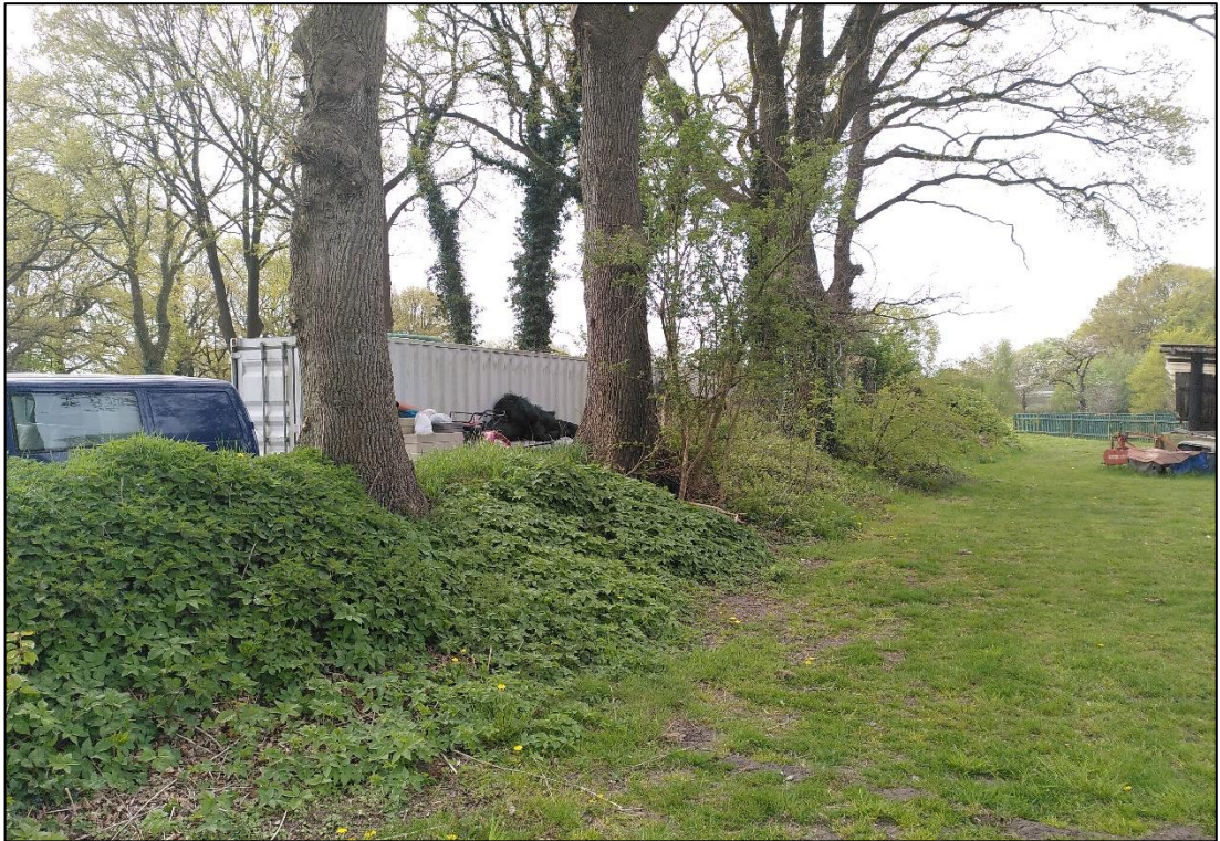
Abbildung 2: Baum-Wallhecke am Nordöstlichen Rand des Plangebiets. Foto: Mai 2022, Stutzmann.

Entlang der Oldenburger Straße wurde ein Sonstiger standortgerechter Gehölzbestand (HPS) aus Stiel-Eichen, Ahorn, Gewöhnlicher Esche ( Fraxinus excelsior ) und vereinzelt Fichten ( Picea abies ) mit Brusthöhendurchmessern zwischen 0,2 und 0,7 m erfasst. Die Eschen sind aufgrund des Befalls mit Falschem Weißen Stängelbecherchen (Eschentriebsterben) deutlich abgängig. Ein Teil der Eschen wurde kurz vor der Geländebegehung infolge von Sturmschäden gerodet.