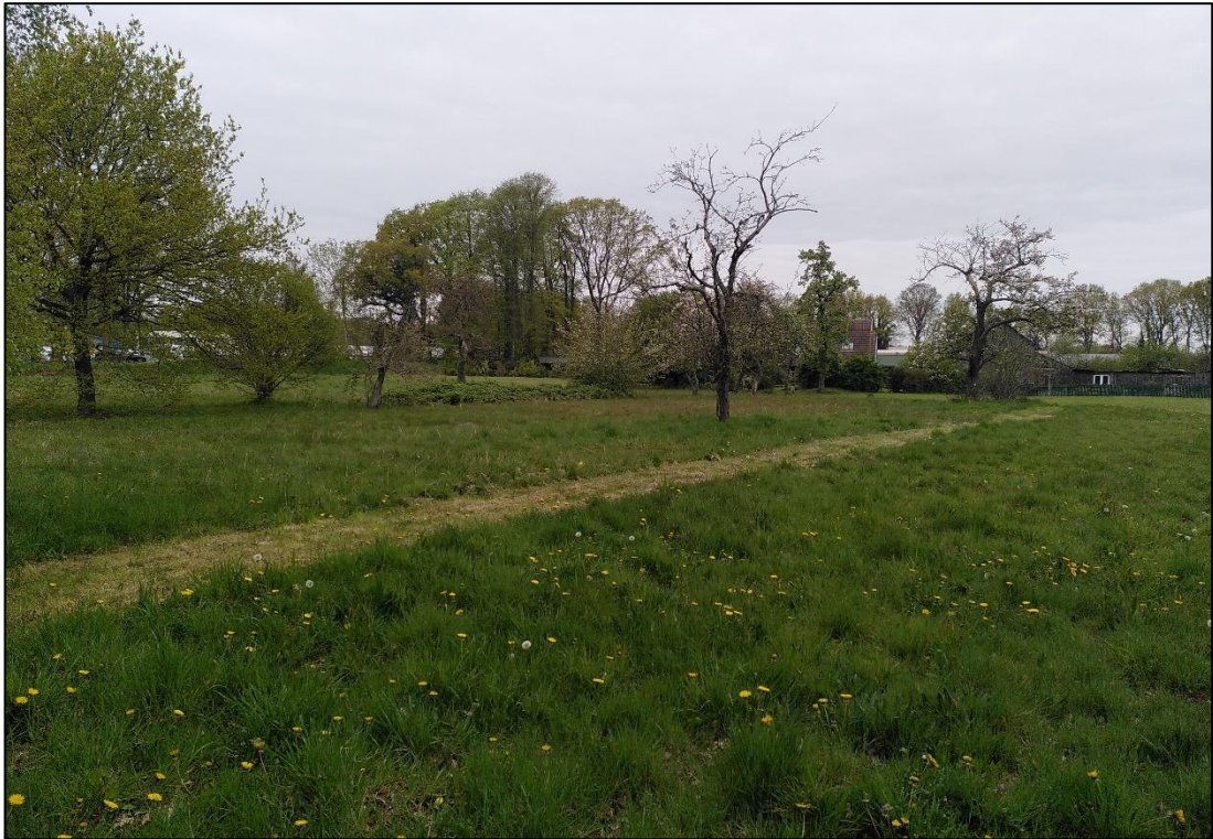
Abbildung 1: Gehölze im zentralen Bereich des Plangebiets. Foto: Mai 2022, Stutzmann.

Im Norden des Plangebiets verläuft eine kurze - vor einigen Jahren auf Stock gesetzte - Hecke, die derzeit als Strauchhecke (HFS) einzustufen ist. Dominierende Gehölze sind Hainbuchen ( Carpinus betulus ) und Rot-Buchen ( Fagus sylvatica ).