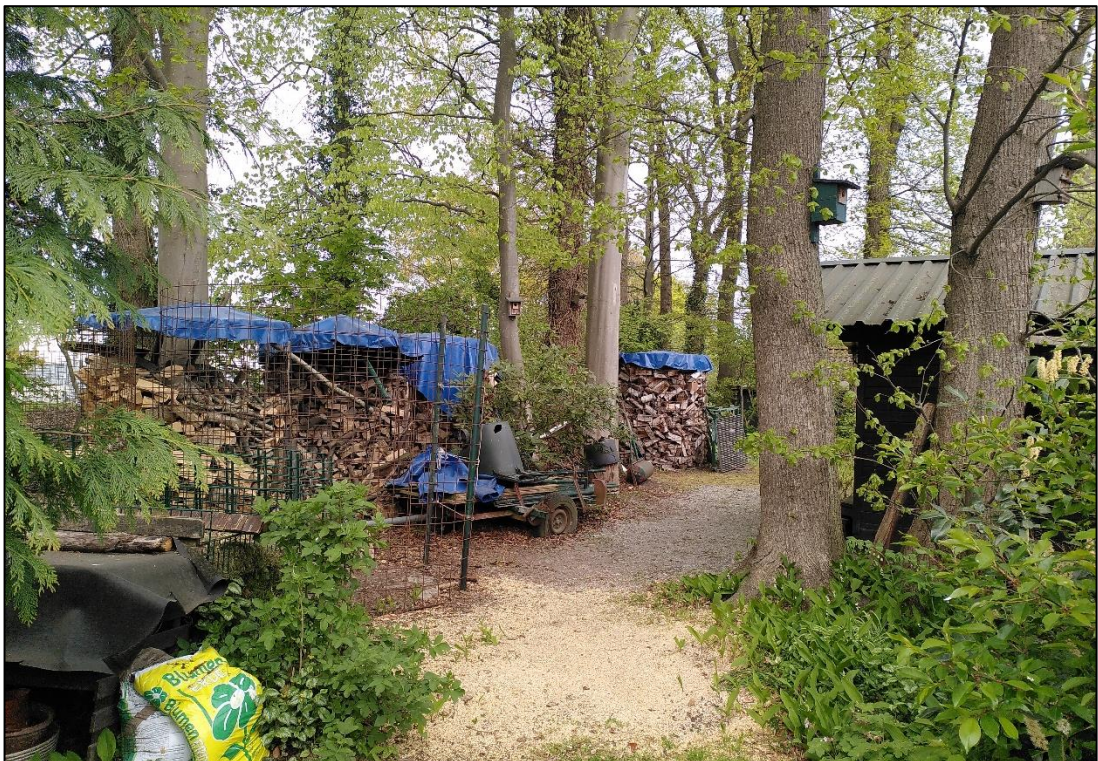
Abbildung 7: Hausgarten mit Großbäumen im Westen von Flurstück 96/4. Foto: Mai 2022, Stutzmann.

In den Randbereichen von Flurstück 96/4 wurden mehrere Abschnitte Artenreicher Scherrasen (GRR) mit kurzer, regelmäßig gepflegter Grasnarbe und typischer tritt- und schnittverträglicher Vegetation festgestellt. Sie befinden sich außerhalb der eigentlichen Gartenflächen und wurden deshalb gesondert erfasst.