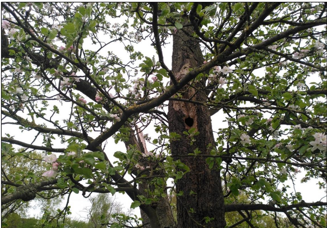
Abbildung 9: Spechthöhle im Stamm des Habitatbaums. Foto: Mai 2022, Stutzmann.