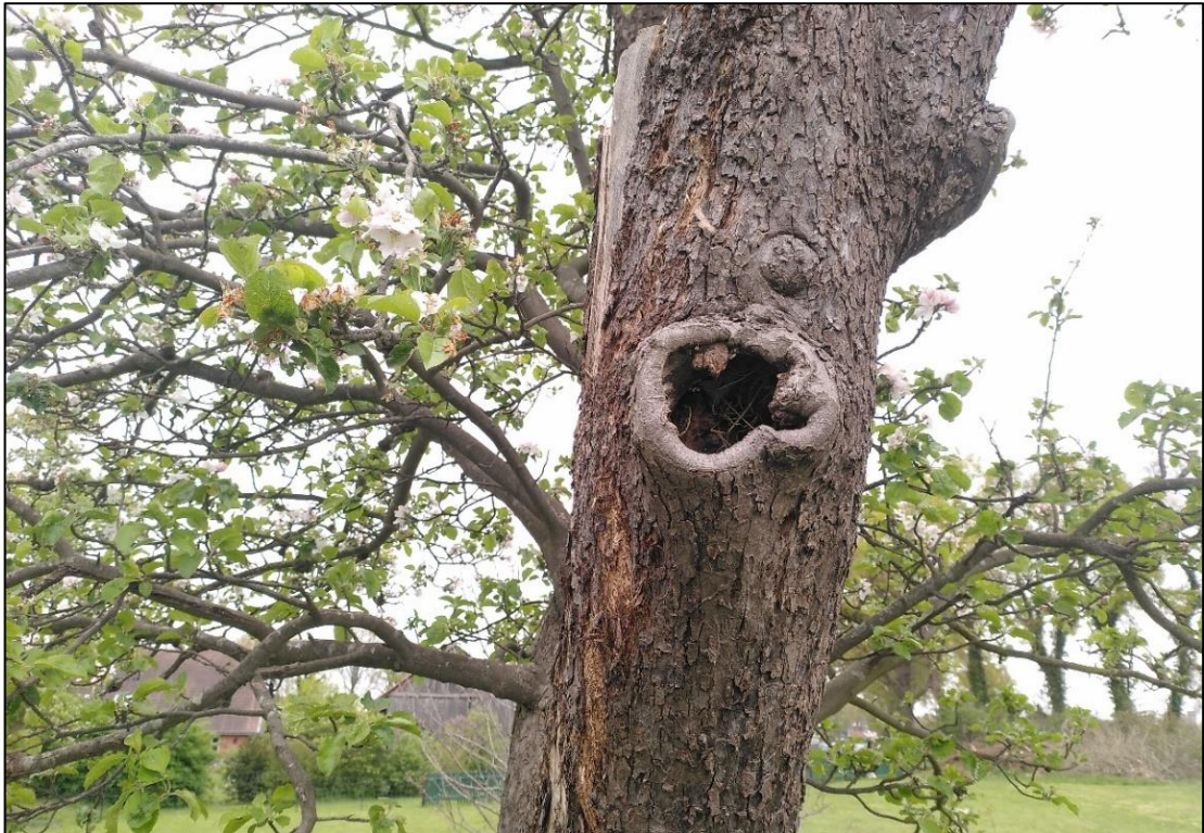
Abbildung 8: Eine der Höhlungen im Habitatbaum. Foto: Mai 2022, Stutzmann