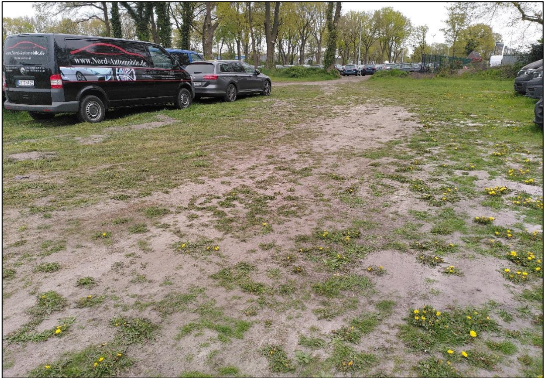
Abbildung 5: Trittrasen im Nordosten des Plangebiets.

Der Garten im Bereich von Flurstück 96/4 ist teilweise als Neuzeitlicher Ziergarten (PHZ) mit Rasenflächen und Ziersträuchern einzustufen (Abbildung 6), teilweise wird er von einem dichten Baumbestand aus Stiel-Eichen und Rot-Buchen bestimmt. Die Brusthöhen betragen 0,3-0,8 m. Dieser Teilbereich wurde als Hausgarten mit Großbäumen (PHG) eingestuft (Abbildung 7).