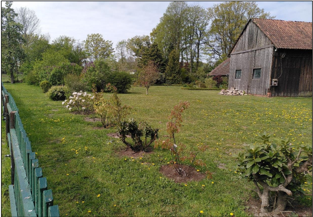
Abbildung 6: Neuzeitlicher Ziergarten im Flurstück 96/4. Foto: Mai 2022, Stutzmann.