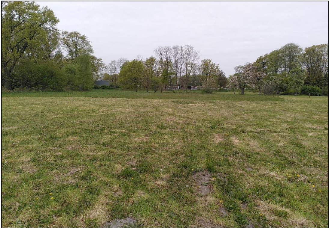
Abbildung 4: Scherrasen mit Tendenz zum mesophilen Grünland im südlichen Plangebiet. Foto: Mai 2022, Stutzmann.

Angrenzend an die beschriebenen Scherrasen befindet sich auch eine Trittrasenfläche (GRT) im Plangebiet. Sie wird als Stellfläche für Fahrzeuge des angrenzenden Autohauses genutzt. Sie weist hohe Offenbodenanteile sowie trittverträgliche Gräser und Kräuter wie Spitz-Wegerich, Echten Löwenzahn und Kriechenden Hahnenfuß ( Ranunculus repens ) auf (Abbildung 5).